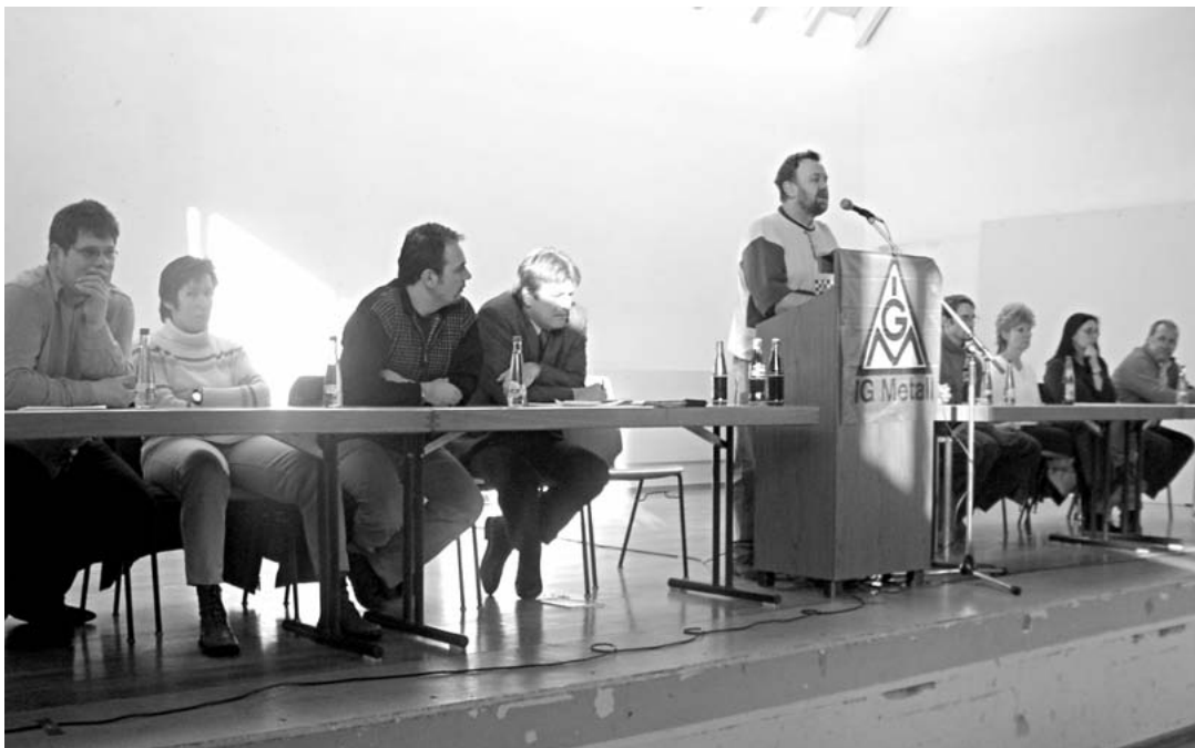
Betriebsrat Metallwerke Helmstadt

Mehrmals wurde darauf hingewiesen, dass der Verhandlungserfolg und die Durchsetzungskraft auch vom Organisationsgrad der Betroffenen abhängt. Deshalb starten IG Metall und Betriebsrat sofort eine Mitglieder-Gewinnungs-Kampagne, da immer noch über die Hälfte der Stammebelegschaft nicht organisiert ist.