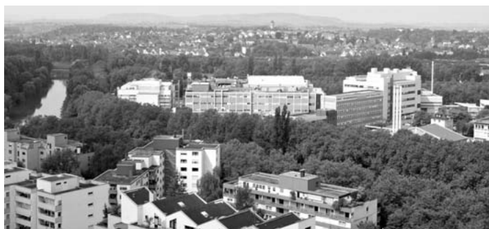
Sechs Firmen, 2000 Arbeitsplätze: Unsicherheit am High-Tech-Standort Theresienstraße