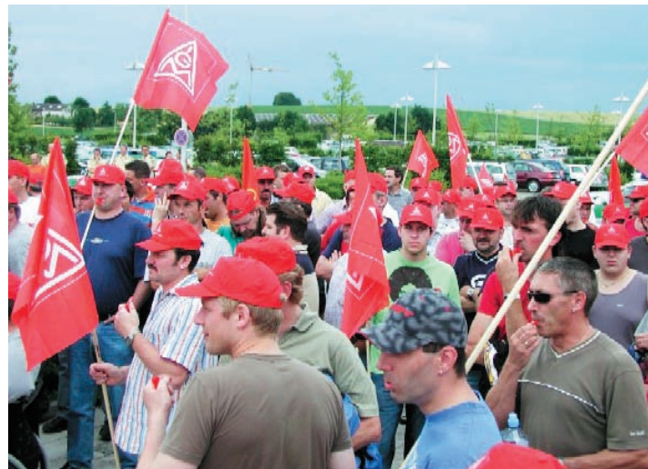
Durchbruch nach Protest vor der Getrag-Hauptverwaltung Untergruppenbach

Belegschaften. Nach einer Protestkundgebung mit rund 1000 Beschäftigten vor der Hauptverwaltung in Untergruppenbach