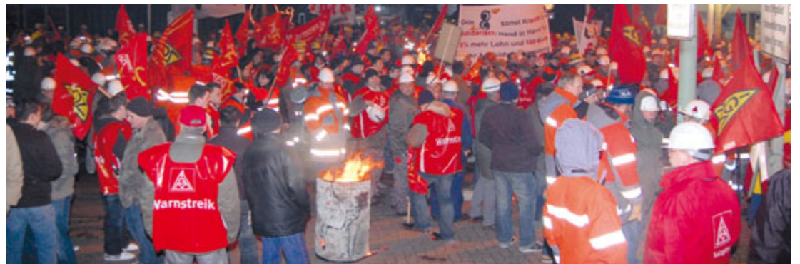
Direkt nach Ablauf der Friedenspflicht gab es aufgeheizte Stimmung trotz eisigem Sturm.

gelehnt werden konnte. Die Arbeitgeber haben damit eine weitere Warnstreikwelle vor der vierten Verhandlung provoziert und wir werden weiter Druck machen für unsere Forderung »Mehr muss her«. ■