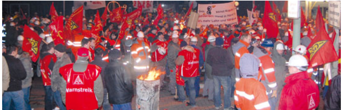
Direkt nach Ablauf der Friedenspflicht gab es aufgeheizte Stimmung trotz eisigem Sturm.

Pünktlich mit dem Auslaufen der Friedenspflicht legten die Stahlbeschäftigten in Salzgitter die Arbeit nieder. Nach diesem stürmischen Auftakt in die Stahltarifrunde schlossen sich eine Woche später auch die Kolleginnen und Kollegen der SZAG-Betriebe in Peine an.