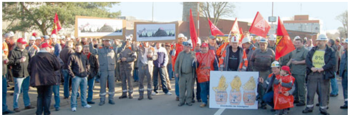
Bei strahlendem Sonnenschein ging bei der PTG nichts mehr.

gelehnt werden konnte. Die Arbeitgeber haben damit eine weitere Warnstreikwelle vor der vierten Verhandlung provoziert und wir werden weiter Druck machen für unsere Forderung »Mehr muss her«. ■