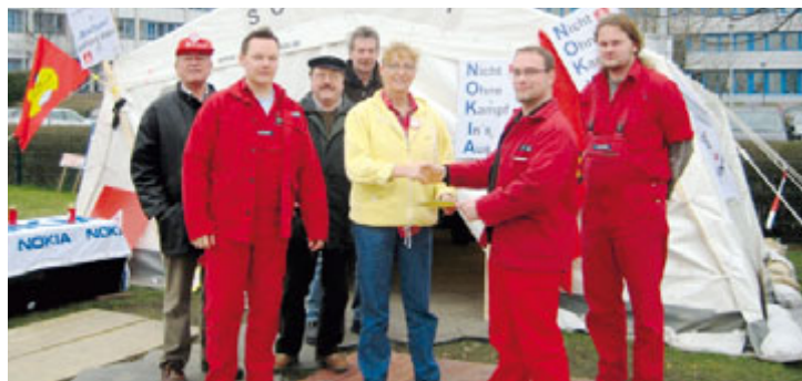
Am Mittwoch, 30. Januar, besuchte eine Delegation aus dem Stahlbereich das Soli-Zelt am Werkstor von Nokia.

Auch Kolleginnen und Kollegen aus der Osnabrücker Region unterstützen die Nokia-Beschäftigten.