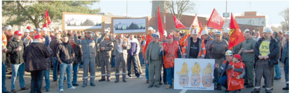
Bei strahlendem Sonnenschein ging bei der PTG nichts mehr.

Pünktlich mit dem Auslaufen der Friedenspflicht legten die Stahlbeschäftigten in Salzgitter die Arbeit nieder. Nach diesem stürmischen Auftakt in die Stahltarifrunde schlossen sich eine Woche später auch die Kolleginnen und Kollegen der SZAG Betriebe in Peine an.