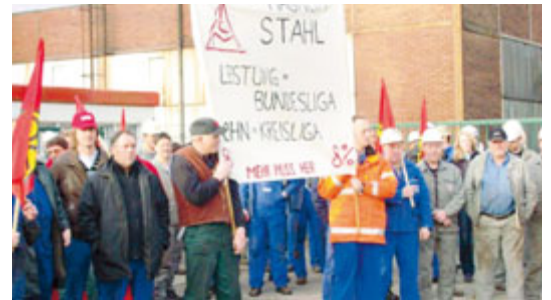
Warnstreik der Firmen Magnum GmbH, IAG GmbH und WBO GmbH vor dem Werkstor der Firma Magnum.

Am Donnerstag, 7. Februar, schalteten die Beschäftigten der Frühschicht der Georgsmarienhütte GmbH pünktlich um neun Uhr die Anlagen ab.