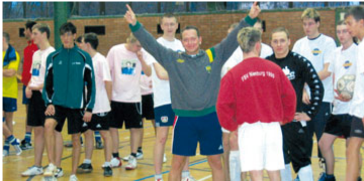
Das Siegerteam vom Flanschenwerk Bebitz beim Hallenfußballcup der IG Metall Jugend am 12. Januar in Magdeburg.