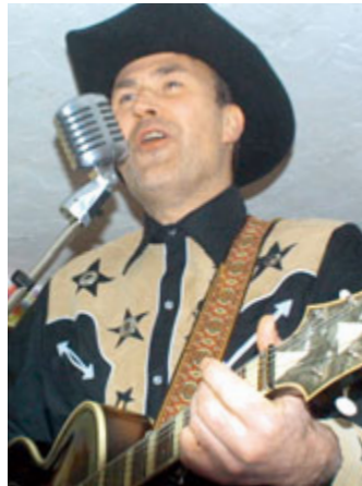
Metaller im »Goldrausch«: in die Welt der Prärien eingetaucht.

»Die Kollegen bei VW haben maßgeblich zur Entstehung der