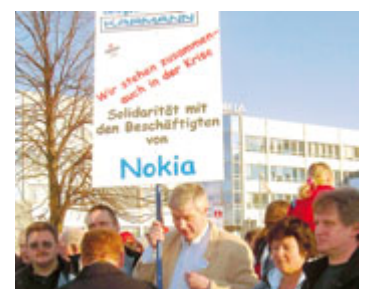
Beschäftigte der Firma Karmann und aus anderen Betrieben beteiligten sich an der Menschenkette am Sonntag, 10. Februar, bei Nokia.