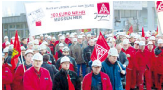
»Wir wollen unseren gerechten Anteil«: Warnstreik bei der Georgsmarienhütte GmbH.

Stahlarbeiter der Georgsmarienhütte GmbH, Magnum Metallbearbeitung GmbH, IAG Industrie-Anlagenbau GmbH und WBO Wärmebehandlung GmbH streikten vor den Werkstoren.