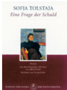
Sofja Tolstaja »Eine Frage der Schuld«. Manesse Verlag Zürich, 314 Seiten, 19,90 Euro.

Sofjas Emanzipationsroman aus dem Jahre 1893 liegt nun erstmals in deutscher Sprache vor. Eine passende Lektüre zum 8. März.