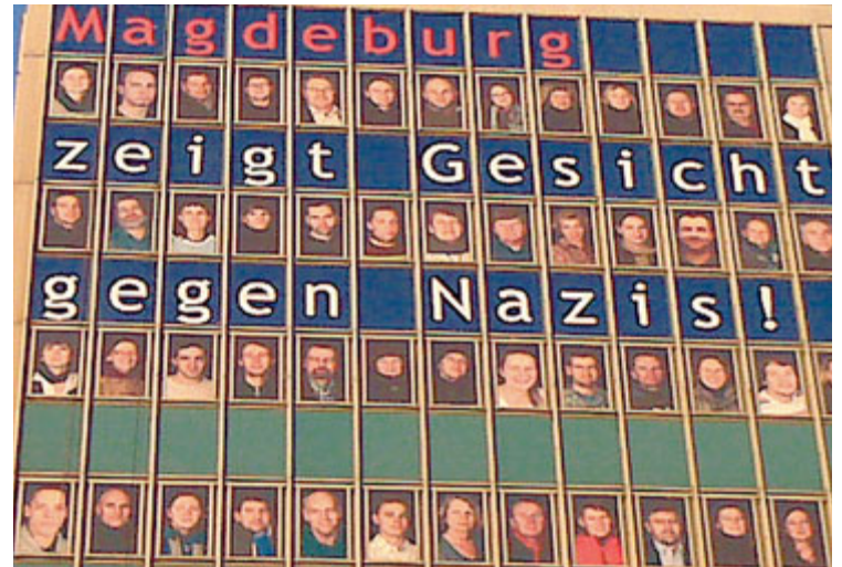
Viele Magdeburgerinnen und Magdeburger beteiligten sich an der Aktion »Magdeburg zeigt Gesicht gegen Rechts« am Haus des Lehrers.

Aus Anlass des 64. Jahrestages der Zerstörung Magdeburgs organisierte das Bündnis gegen Rechts am 17. Januar eine »Meile der Demokratie« vom Hasselbachplatz bis zum Uni-Platz. Für IG Metall ist es keine Frage des Alters, sich zu beteiligen. Jeder war aufgefordert mitzumachen. Die IG Metall-Jugend beteiligte sich mit einem großen Stand und kooperierte mit dem Studentclub »Kiste e.V.«, einem Jugendverein der Medizinischen Fakultät der Uni. Es gab ein Großtransparent, auf dem jeder seine Gedanken gegen rechtes Gedankengut verewigen konnte. An der Meile der Demokratie beteiligten sich Gewerkschaften, Kirchen, Parteien und Magdeburger Vereine. Die Meile der Demokratie verhinderte, dass die Rechten im Zentrum der Stadt demonstrieren konnten.